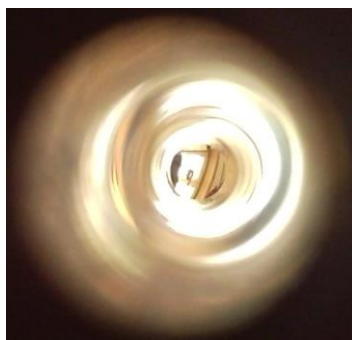
Endlich wieder ohne Blaswiderstand spielen